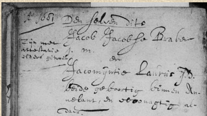
II-a - DTB-Sint-Annaland (Ned.geref) Ondertrouw 9-4-1681